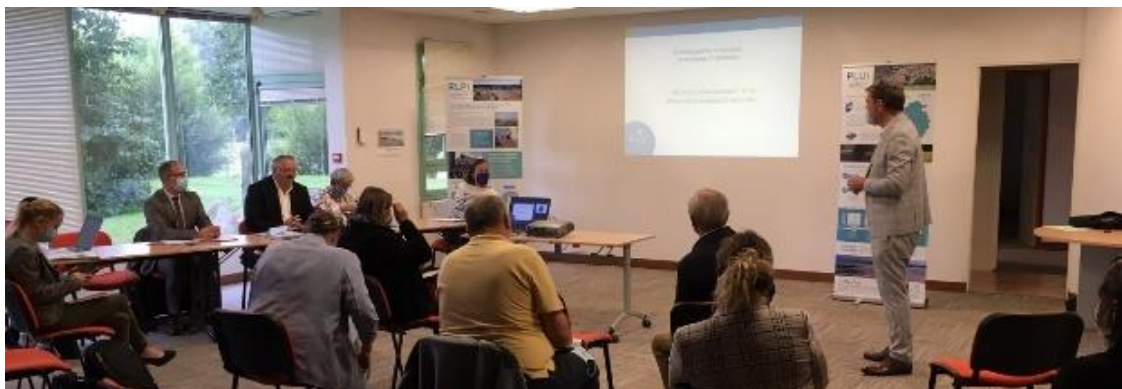
Rencontre communale PLUi – Gavray – 15 / 09 /2021